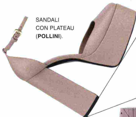
SANDALI CON PLATEAU (POLLINI).