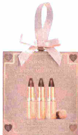
ICONIC MINI LIP TRIO (CHARLOTTE TILBURY, € 30).