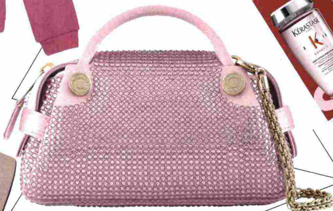
BORSA IN RASO E STRASS (GIORGIO ARMANI, € 2.400).