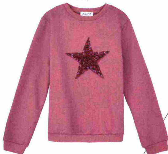
MAGLIA CON STELLA (MOLLY BRACKEN, € 45).