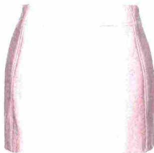
GONNA EFFETTO COCCODRILLO (PINKO, € 225).