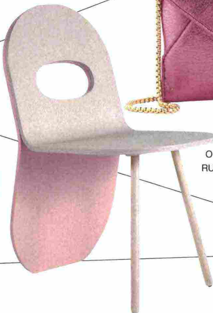
SEDIA KALMO, DESIGN KARIM RASHID (DRIADE).